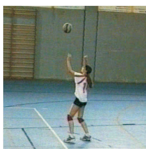
Chiara: pallavolo con gesso di Risser