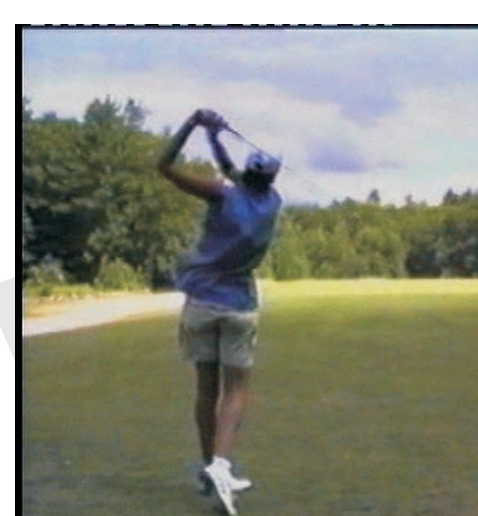
Paola: golf con gesso di Risser